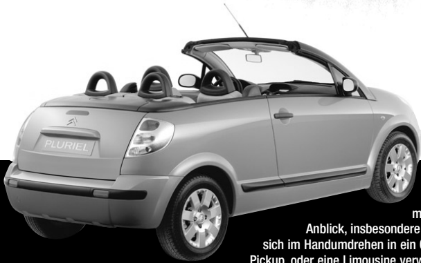
Citroën C3 Pluriel

Die gesamte Citroën-Modellpalette bietet Ihnen mehr als nur einen schönen Anblick, insbesondere der Citroën C3 Pluriel, der sich im Handumdrehen in ein Cabrio, einen Spider, einen Pickup, oder eine Limousine verwandeln lässt. Ein Auto mit vielen Konfigurationen, das Sie immer wieder begeistern wird. Citroën C3 Pluriel: das Leben ist schön.